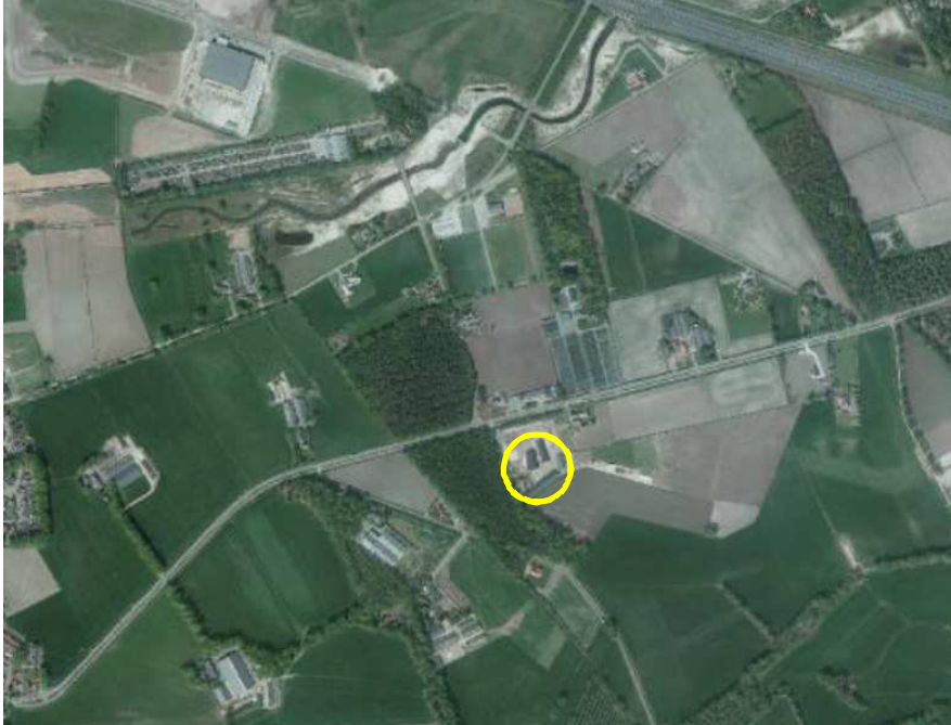
Globale ligging van het plangebied in de omgeving. Het plangebied wordt met de gele cirkel aangeduid.

Het plangebied is gesitueerd op het adres Bolscher Landen 27/29 in Bornerbroek. Het ligt in het buitengebied, iets ten oosten van de kern Bornerbroek. Op onderstaande afbeelding wordt de globale ligging van het plangebied weergegeven.