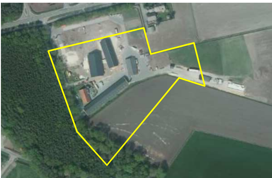
Detailopname van het plangebied. Het gebied wordt met de gele lijn aangeduid.

Op het adres is zorgboerderij De Zegger gevestigd. Op het adres staat een boerderij een verschillende, vrij moderne, schuren/stallen. Alle gebouwen zijn gebouwd met baksteen en gedekt met golfplaat. Ten zuiden van het erf ligt een strook agrarische cultuurgrond. Tijdens het veldbezoek in gebruik als grasland. Het meest zuidelijke deel van het plangebied bestaat uit oud loofbos.